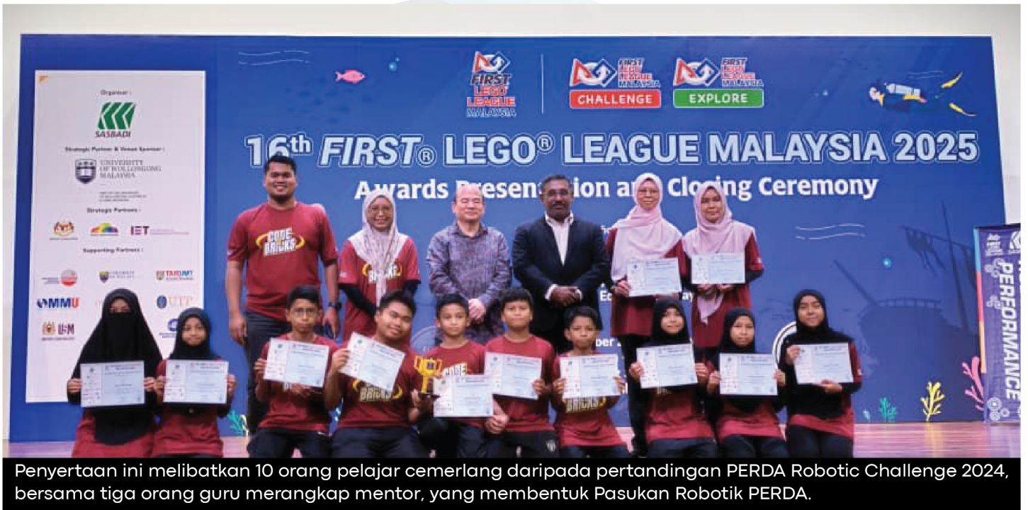
Penyertaan ini melibatkan 10 orang pelajar cemerlang daripada pertandingan PERDA Robotic Challenge 2024, bersama tiga orang guru merangkap mentor, yang membentuk Pasukan Robotik PERDA.