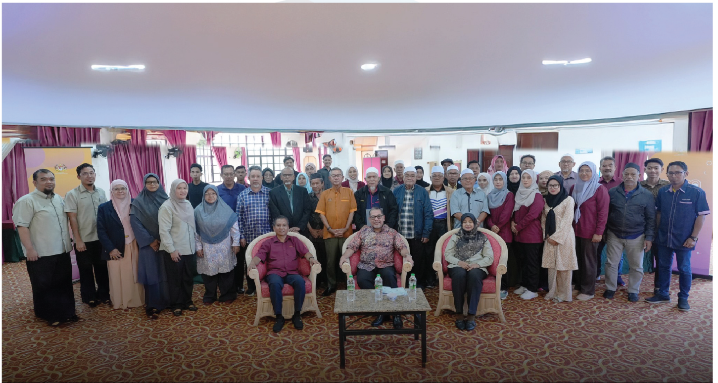
Barisan peserta dan urusetia dalam Program Pemantapan Kampung Angkat Madani bersama Pengurus Besar PERDA.